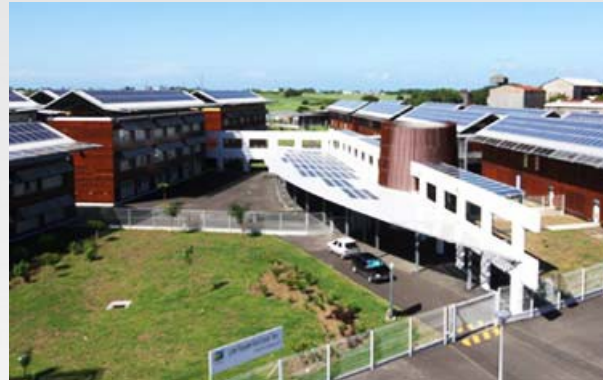
LPO Nord Grande-Terre Site de Beauport 97117 Port-Louis Guadeloupe