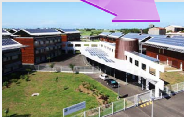
LPO Nord Grande-Terre Site de Beauport 97117 Port-Louis Guadeloupe