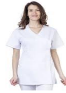
Haut cuisine blanc