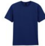
Tee-shirt bleu marine